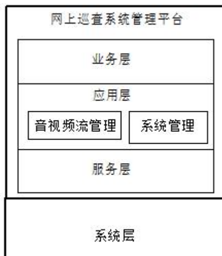
图-3. 系统软件参考模型

系统软件参考模型包括系统层和网上巡查系统管理平台，网上巡查系统管理平台建立在系统层的服务之上。网上巡查系统管理平台结构上从高到低分成业务层、应用层和服务层。系统软件参考模型如图-3 所示。